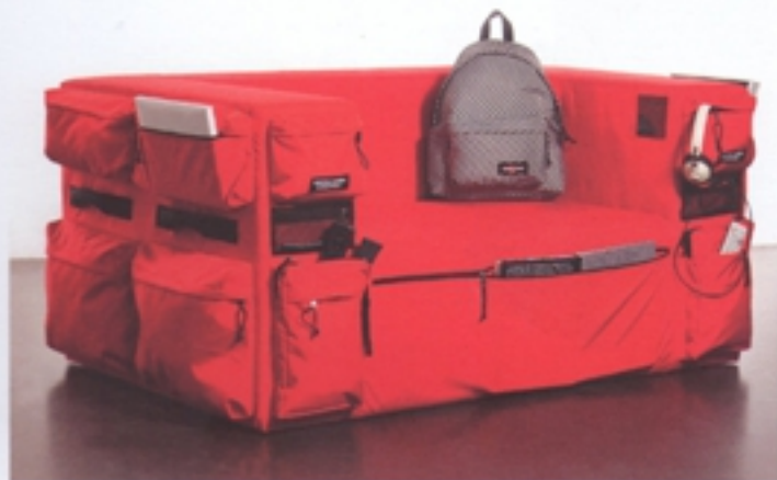
Colección Built to Resist de Quinze & Milan y Eastpak. Concebido casi como un sofá-mochila, ya que lleva incorporados múltiples departamentos y está realizado con los mismos tejidos que las mochilas Eastpak.

Son precisamente las empresas que destinan sus productos a consumidores de un poder adquisitivo medio las que están empezando a proponer soluciones creativas para los espacios domésticos. Tienen muy en cuenta la relación calidad-beneficio para el usuario y precio. Si hay una empresa que representa esta tendencia es Campeggi SRL, ya que ha formado parte siempre de su identidad dar solución a este tipo de cuestiones relacionadas con el espacio y la movilidad. Pero esta vocación se está extendiendo cada vez más a todo tipo de empresas que tratan de dar respuesta a estas nuevas necesidades como es el caso de Danese, Soca,