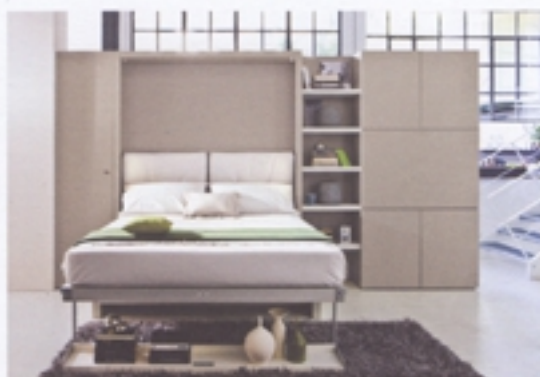
Nuovototà 10 de Ciel.